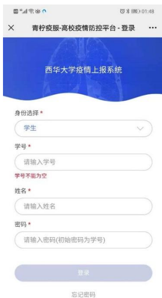
输入系统已预置的学号姓名密码后