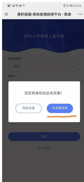
登陆系统后首先务必完善个人信息即可登陆系统