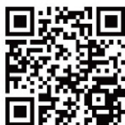
西华大学官方微博