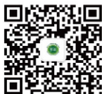
（国际教育学院官微）