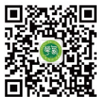
西华大学招生微信二维码

新生凭录取通知书到高考报名所在县（区）招办领取纸质档案，入学报到时交班主任，由班主任统一收取后交招生与就业处；或由新生所在县（区）招办统一邮寄到西华大学招生与就业处。纸质档案是考生重要材料，新生务必及时跟踪查询，请扫描关注西华大学招生微信二维码，在“档案跟踪”菜单中填写快递单号，确保自己的档案安全到校。