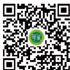
西华大学官方微信